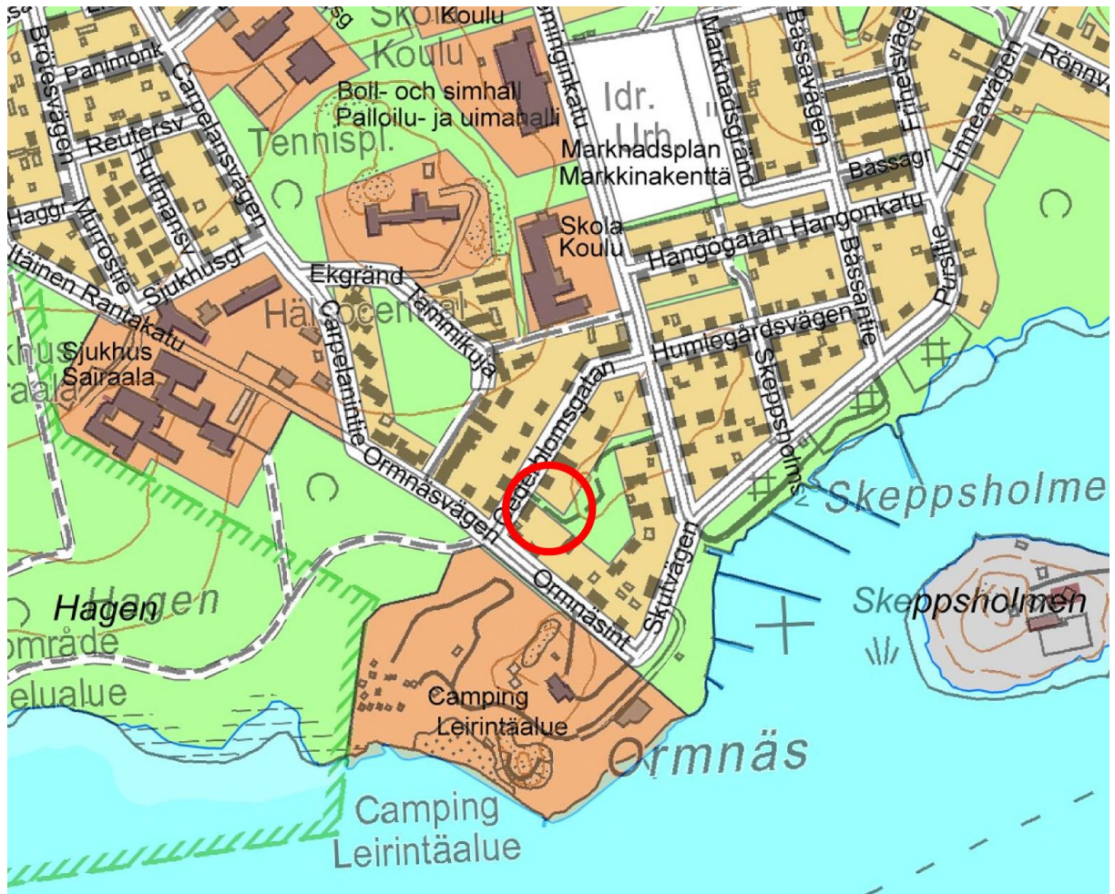
Kuva 1: Suunnittelualueen sijainti

Maankäyttö- rakennuslain 62§:n ja 63§:n mukainen Osallistumis- ja arviointisuunnitelma