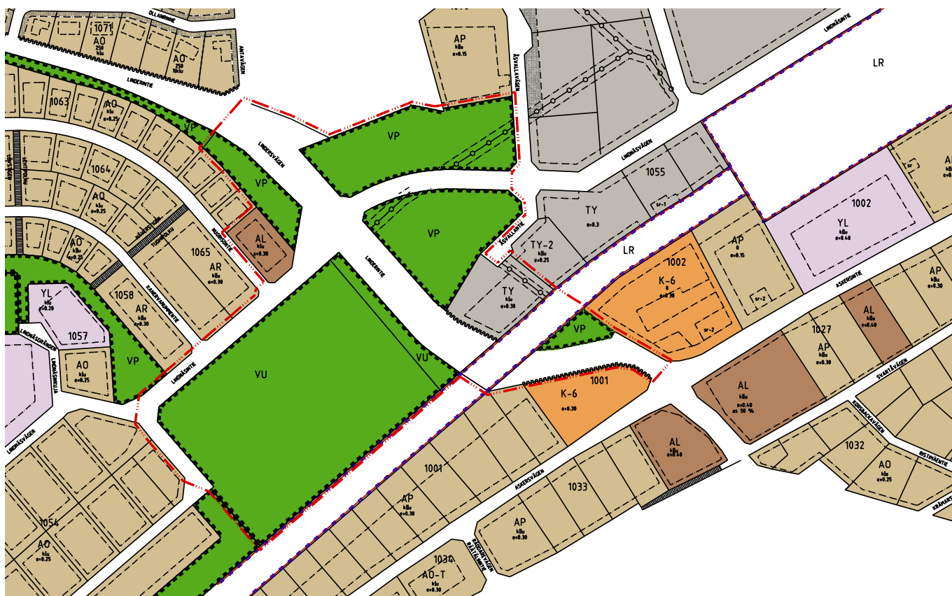
Utdrag ur den gällande detaljplan. Planändringsområdet har avgränsats med den röda streckade linjen. Ote ajantasa-asemakaavasta. Kaavamuutosalue on rajattu punaisella katkoviivalla.

Alueella on voimassa kaksi asemakaavaa: 200-100, vahvistettu 26.6.1994 166-100, vahvistettu 21.4.1986